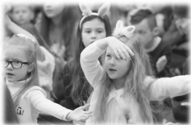
Vaikų Velykų šv. Mišios