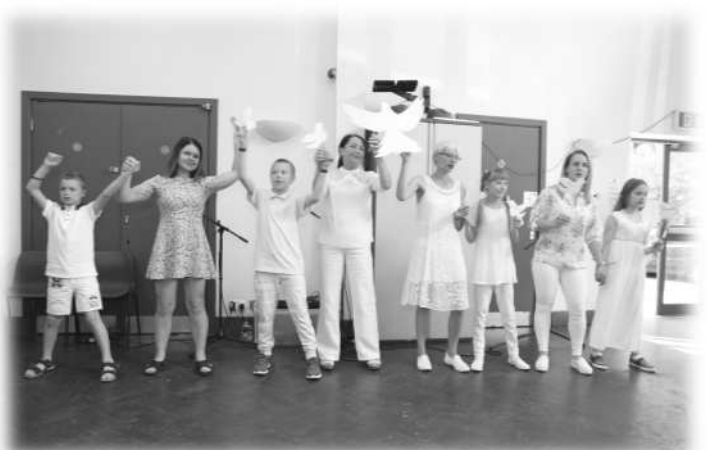
Vaikų pasirengimo Pirmajai Komunijai egzaminas-šventė

Prasidėjus Naujiems metams ir bažnytėlėje pradeda virti naujas gyvenimas – man tai pats geriausias metas, nes tiek visko vyksta, kad net galvelė sukasi bandant visur savo uodegą švystelėti.