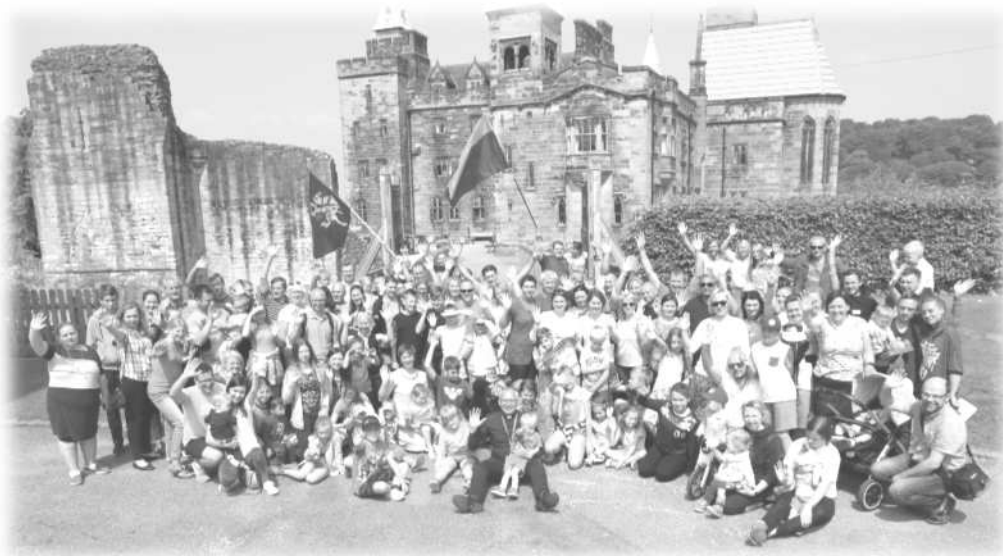
Šeimų stovykla Alton pilyje „Kad jūsų džiaugsmui nieko netrūktų!“