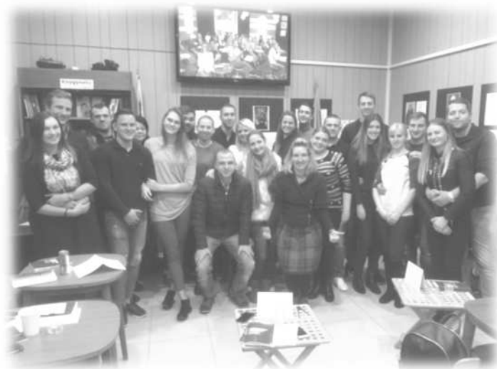
Sužadėtinių pasirengimo Santuokai kursas